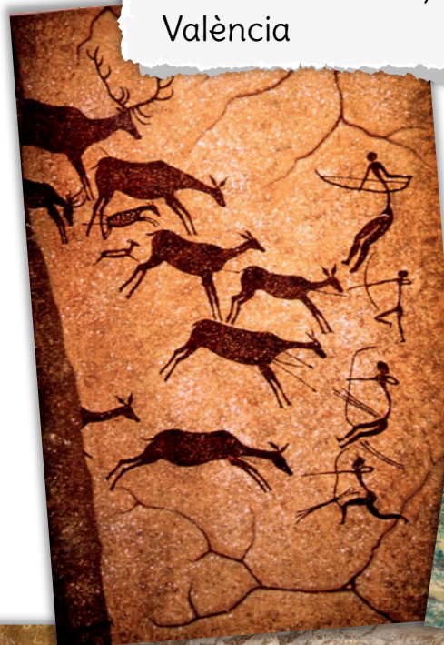
Cova dels Cavalls, València

Es feien amb pigments naturals, des de pigments minerals com la terra i el carbó fins a pigments animals com la sang i el greix, o vegetals com els algunes plantes.